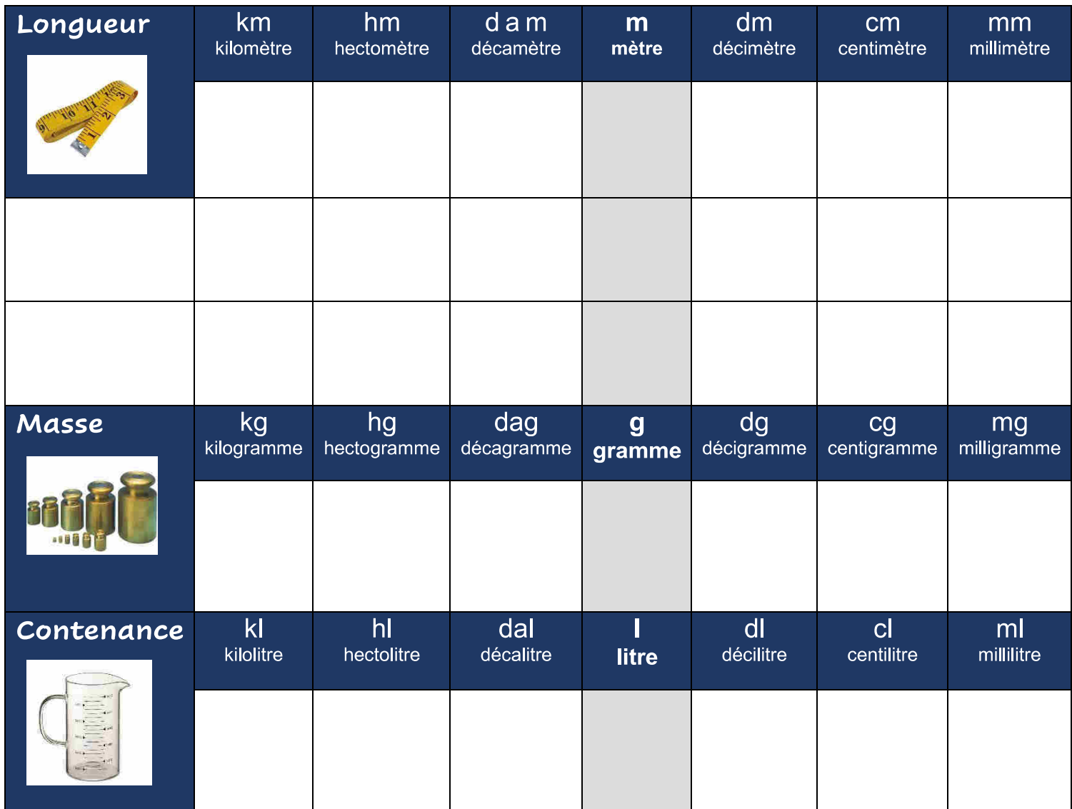
Tableau de conversion